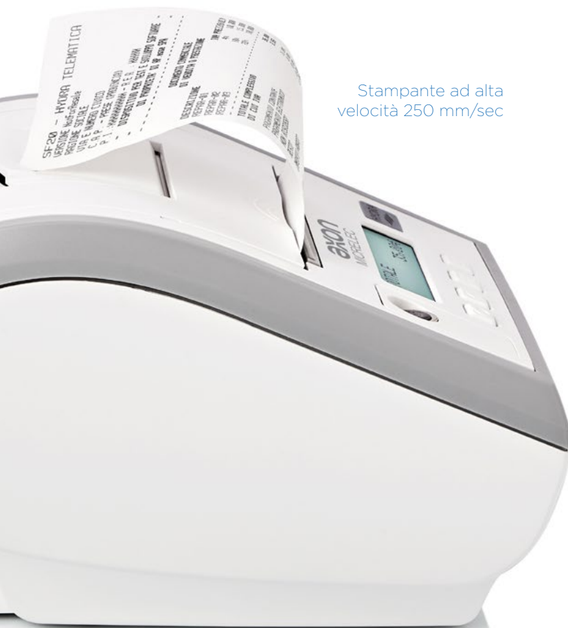
Stampante ad alta velocità 250 mm/sec