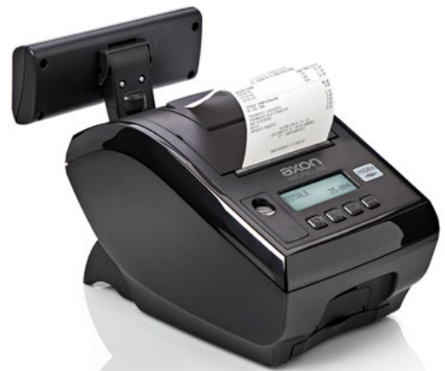
Design elegante e compatto, disponibile in due colori

Il design compatto, le funzionalità avanzate e un set di accessori dedicati consentono di integrare la stampante in qualunque tipologia di punto cassa