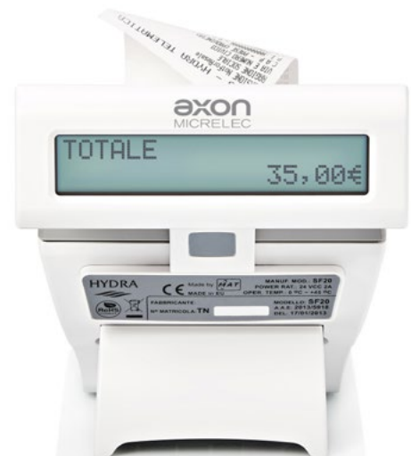
Doppio display ad alta luminosità integrato