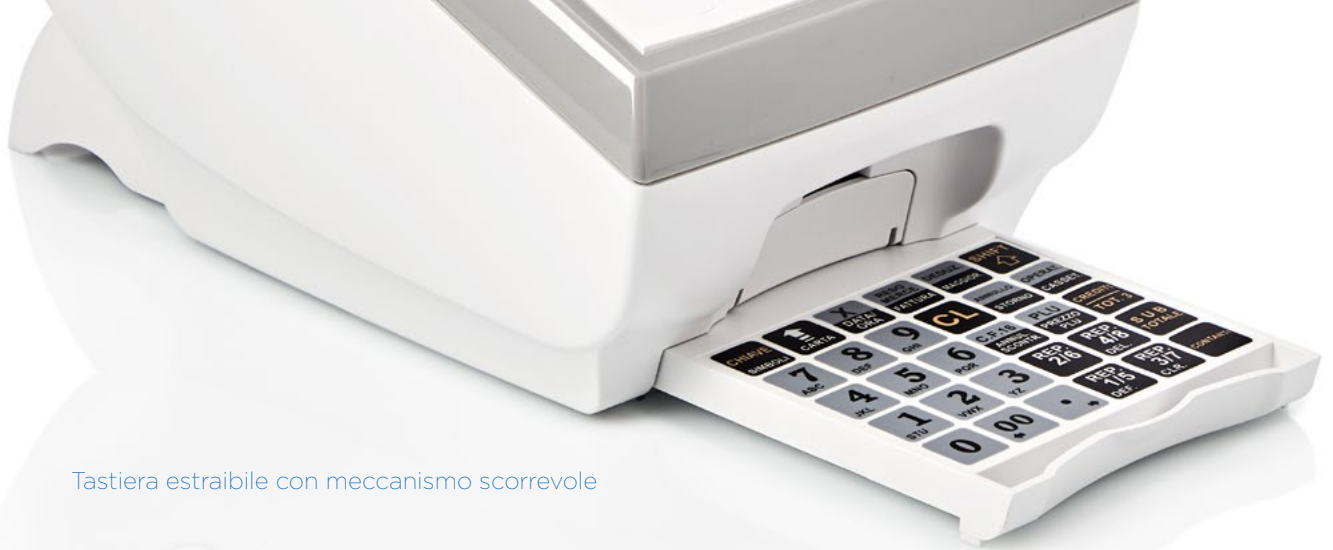
Tastiera estraibile con meccanismo scorrevole